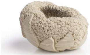
Simone Pheulpin, œuvre « Écllosion Épingles » – 2019. D 15 cm.