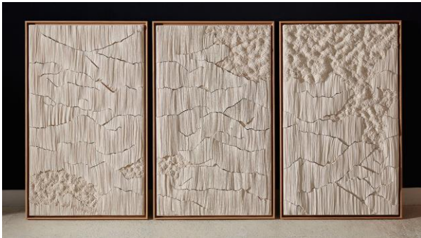
Simone Pheulpin. Triptyque 3 panneaux de 130 x 80 cm. 2020.

Fidèle à ses valeurs de préservation du patrimoine, le Musée des Arts Décoratifs rend hommage au travail remarquable de Simone Pheulpin à travers cette exposition inédite. Représentée par la galerie Maison Parisienne , l'artiste met un point d'honneur à recourir aux dernières manufactures vosgiennes pour son coton et ses épingles. Derrière les portes du musée, ses créations intemporelles prennent place avec une facilité déconcertante aux côtés des pièces phares Art Nouveau ou Art Déco. Un dialogue intergénérationnel qui lie d'un trait d'union l'héritage des savoir-faire français d'exception.