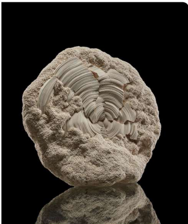
Croissance III (Patrick Roger Collection) ©Antoine Lippens