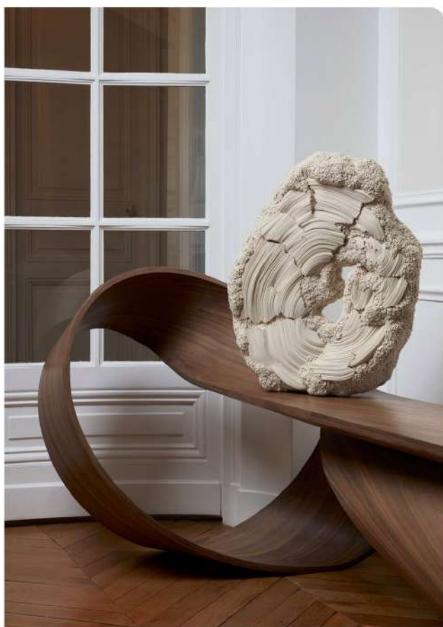
"Hector" - ©Antoine Lippens

"From the creative process itself as a means to reveal the inner structure of my sculptures, intricately assembled with thousands of pins, typically concealed beneath the cotton material. The utilization of X-rays acts as a metamorphic revelation, making the metal structure, once concealed, visible to the viewer. This approach has allowed a new, ethereal dimension to my work".