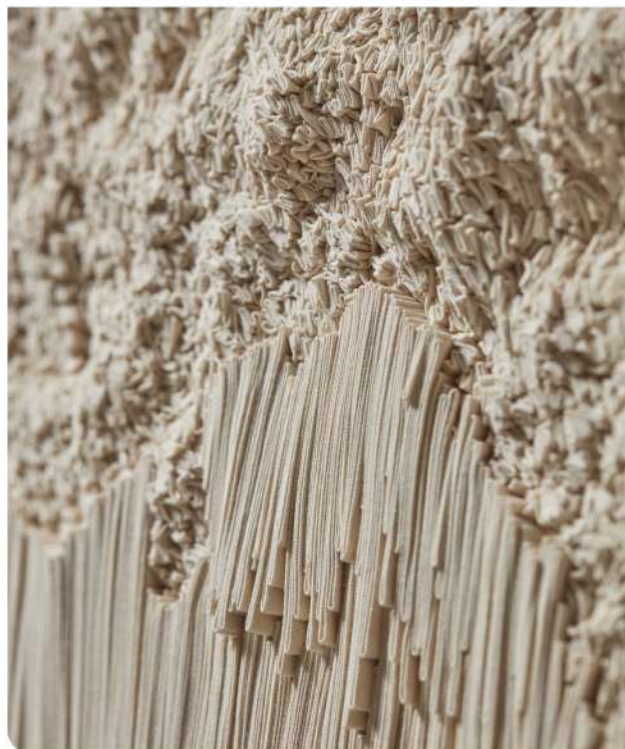
Close up photo